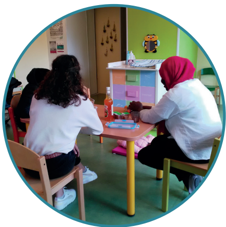
Entretien autour du jeu

Le T2 de transition est un dispositif d'accueil d'urgence qui s'adresse à toute famille qui doit être protégée, mise à l'abri dans un délai rapide.