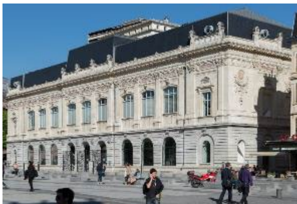
Musée des Beaux-Arts

Situé au centre-ville, l'actuel musée des Beaux-Arts de Chambéry est un établissement municipal, né de l'aménagement au milieu du XIX e siècle d'une ancienne halle aux grains en bibliothèque. Après le rattachement de la Savoie à la France en 1860, la municipalité décide de surélever l'ancienne grenette et de dédier le rez-de-chaussée à une galerie de sculpture et à l'école de dessin, le 1 er étage à la bibliothèque et le 2 e étage au musée de peinture avec un éclairage zénithal.